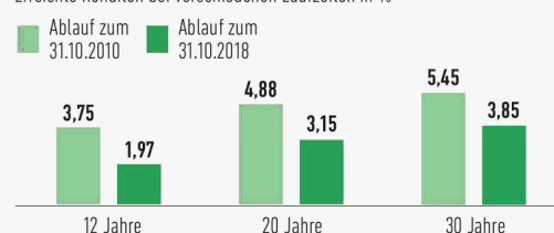
Welche Versicherer die höchsten Renditen bieten 2)

Erreichte Renditen bei verschiedenen Laufzeiten in %